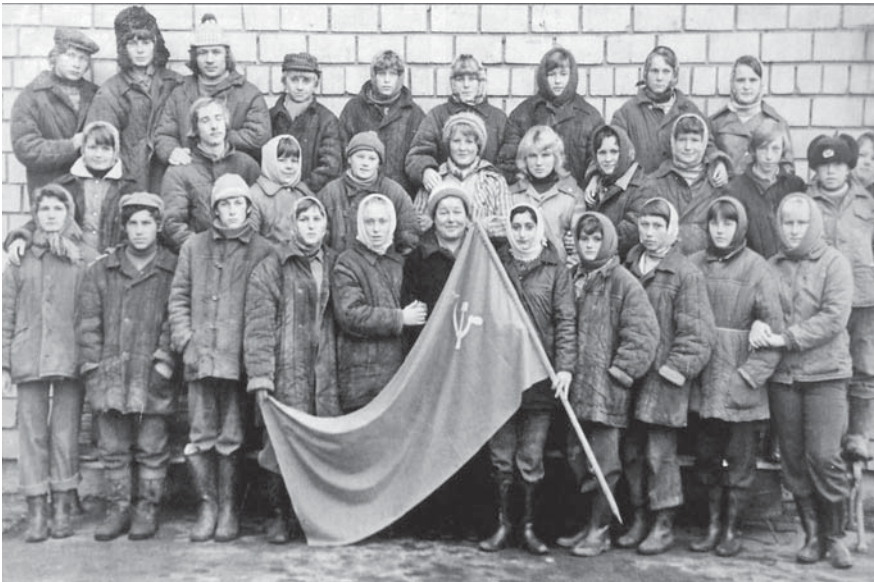
Комсомольцы – победители соцсоревнований

В летнее время выходили в 4 часа утра на работу собирать клубнику и никогда не жаловались на такой распорядок дня. К этой работе привлекались местные жители, особенно было интересно детям, а мы были уже руководителями всего процесса. Зимой занимались запаркой соломы для животноводческих ферм совхоза. Работали в три смены (была смена ночная). Запаренную солому развозили по фермам совхоза.