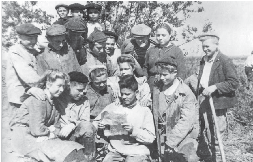
Читка газет в обеденный перерыв