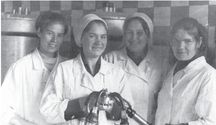
Первая комсомольско-молодежная ферма в районе (совхоз «Борец»)

вать над поймой. Ежегодно создавался полуторатысячный отряд плодородия комсомольцев техникумов и ПТУ района. Бойцы этого отряда пропалывали более тысячи гектаров сельскохозяйственных культур.