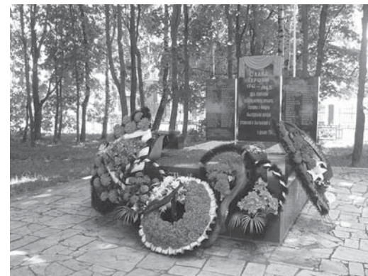
Боевое захоронение в с. Белый Раст