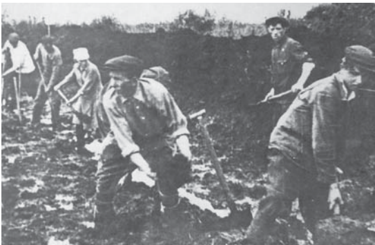
Осушение Яхромской поймы методом народной стройки

кой. Ежедневно сотни комсомольцев и молодежи отвоевывали у болот плодородные земли. Пока не было техники, они вручную прокладывали осушительные каналы, стоя по колено в воде, и ежедневно перевыполняли нормы выработки.