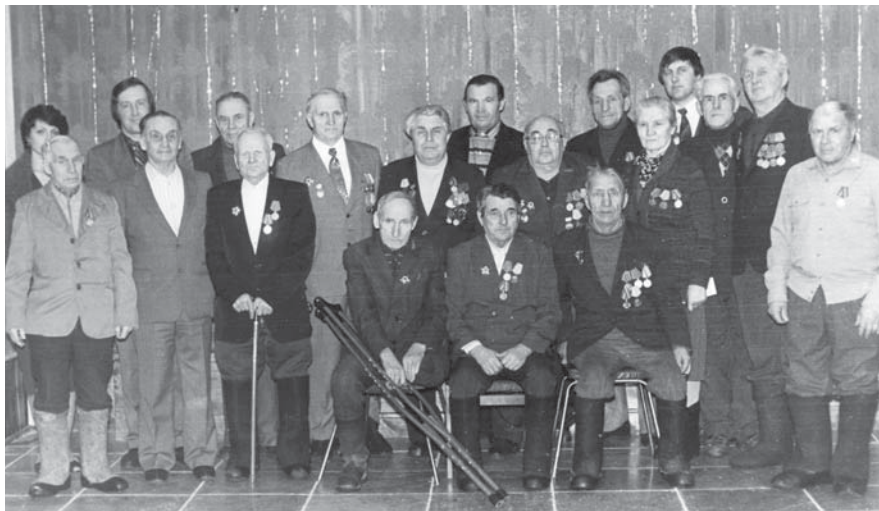
Участники Великой Отечественной войны. Совхоз «Буденновец». 9 мая 1986 г.

В год завершения Великой Отечественной войны в 120 комсомольских районах насчитывалось 1924 члена ВЛКСМ. Они приняли самое активное участие в выполнении четвертого пятилетнего плана восстановления и развития народного хозяйства страны, и не последнюю роль в этом играли сельские комсомольцы и молодежь.