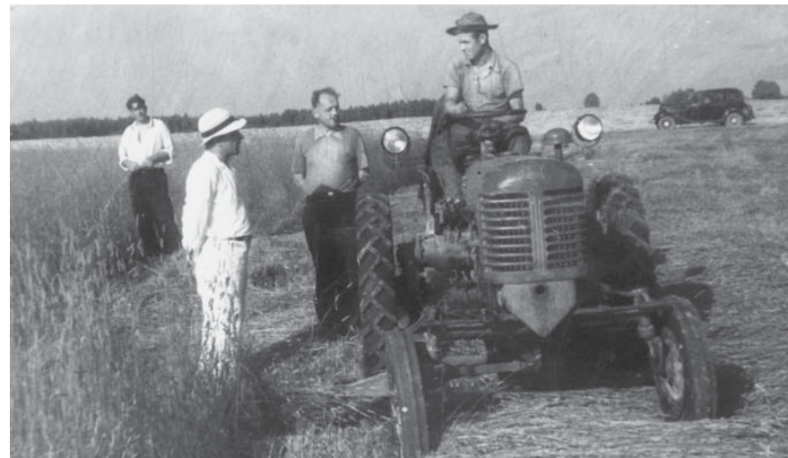
Идет уборка зерновых. Совхоз «Буденновец». Фото нач. 50-х гг.