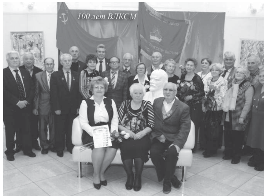
Группа ветеранов комсомола у Красного знамени

29 октября 2018 года состоялось торжественное собрание, посвященное 100-летию образования Всесоюзного Ленинского Коммунистического Союза Молодежи.