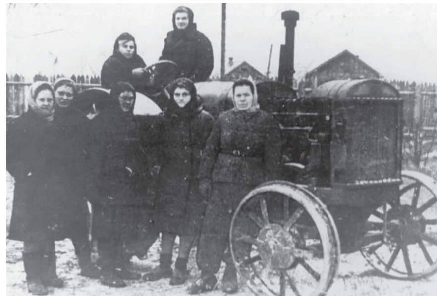
Последовательницы Паши Ангелиной

В результате завершения сплошной коллективизации, объявленной в 1934 г., в районе было создано 327 колхозов, в них объединились 82,5% всех крестьянских хозяйств (10874 из 13102), завершающим был 1935 год, именно в этом году в колхозы было объединено 93,6% всех хозяйств.