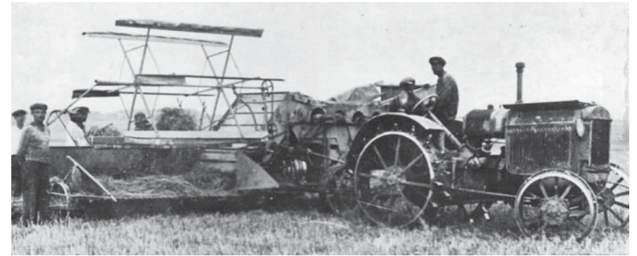
На колхозном поле - первый комбайн

Государство активно способствовало повышению эффек-тивности сельскохозяйственного производства. Принимается решение по организации машинно-тракторных станций (МТС).