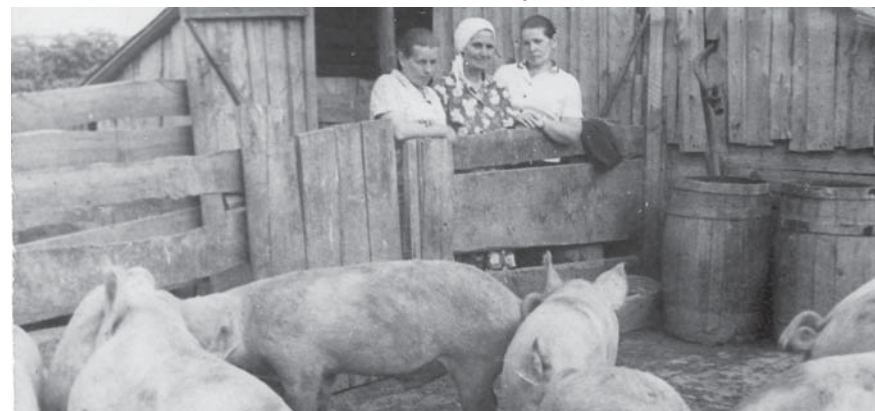
Свиноводческий комплекс. Совхоз «Буденновец». Фото 1960 г.