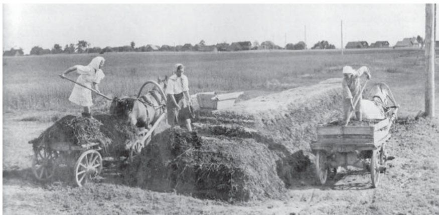
Везде женские руки

10 декабря 1941 г. территория района была полностью очищена от захватчиков. Менее двух недель находились гитлеровцы на части района, но и за этот короткий срок они нанесли огромный ущерб. Было убито 130 и ранено 219 мирных жителей. За это время фашисты сожгли и разрушили 632 дома, 30 школ, 37 лечебных учреждений, 13 библиотек и клубов. В 32 колхозах уничтожили коров, овец, свиней, кур, забрали зерно, картофель, муку. Экономике района был нанесен огромный ущерб, который превысил 248 млн рублей (в масштабах цен того времени).