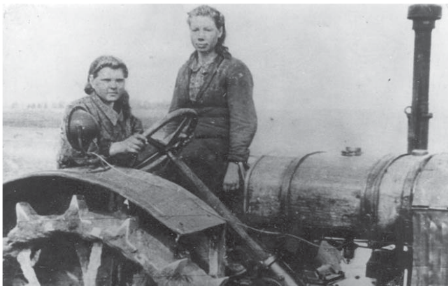
Первая трактористка в колхозе «Колос»

На 1 октября 1929 г. в Дмитровском районе было обобществлено 669 хозяйств (4,7% всех трудовых крестьянских хозяйств), в 1930 - 1350 (8,6%), на 01.03.1931 - 1413 (9,4%). По социальному составу колхозы были середняцкими: 53,2% - крестьяне-середняки, бедняки - 24%, батраки - 7%, рабочих и служащих - 17,9%.