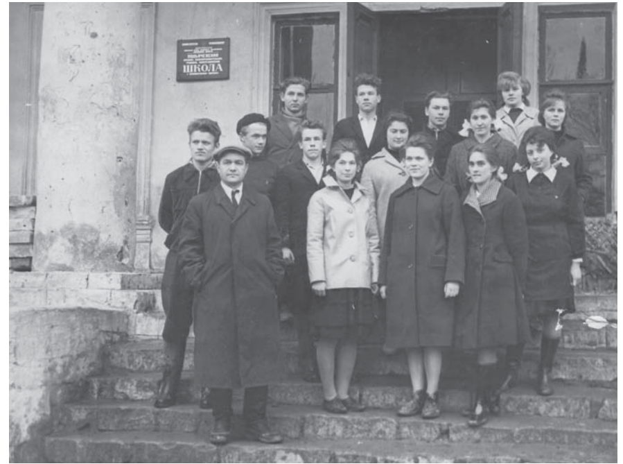
Учащиеся 10 класса Подъячевской школы остались работать в родном хозяйстве

Бюро Московского сельского обкома КПСС одобрило патристический почин учащихся Подъячевской средней школы, кото-