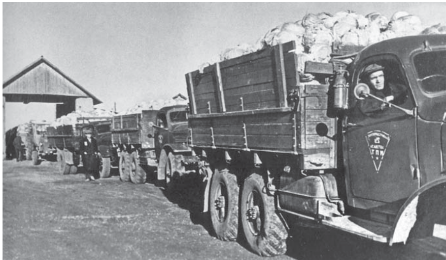
Грузовики с урожаем потоком идут на весовую площадку

Было принято решение о строительстве агрогородков на центральных усадьбах этих хозяйств. Городом юности назвали агрогород в совхозе «Яхромский». Туда по комсомольским путевкам было направлено более 300 человек. Кроме этого, городским комитетом было принято решение, что каждый комсомолец района обязан отработать по 30 часов.